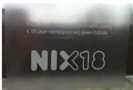
Raamsticker NIX transparant

Geef het aantal aan dat u wenst te ontvangen