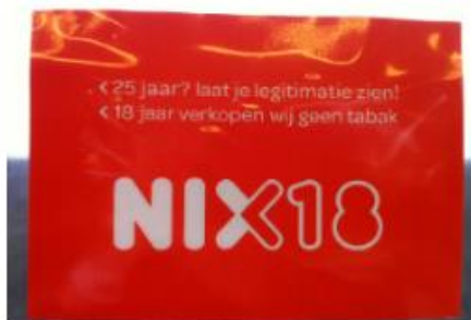
Raamsticker NIX oranje

Geef het aantal aan dat u wenst te ontvangen